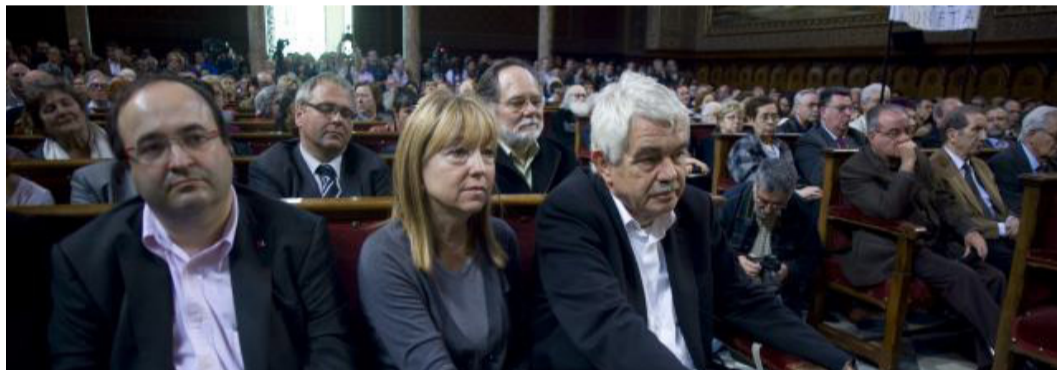
Imatge de l'acte celebrat al paranimf de la Universitat de Barcelona durant l'acte de suport al jutge Garzón

5.- Donar trasllat d'aquests acords a totes les forces polítiques catalanes amb representació parlamentària, al Govern de la Generalitat, al Parlament de Catalunya, al Govern Espanyol, al Congrés i Senat espanyols, al CGPJ i a les associacions de jutges i fiscals de Catalunya i l'Estat.