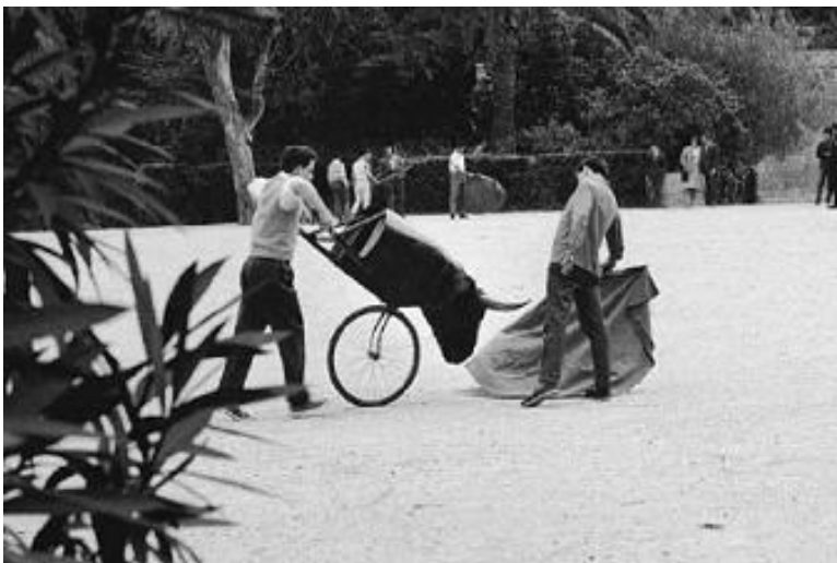
En algunes explanades de Montjuïc (l'espai que ara ocupen les piscines Picornell, una d'elles), era freqüent veure aprenents de torero en els anys seixanta.

Seguint cap amunt, tot seguit trobarem les Piscines Picornell a la nostra dreta. Varen ser inaugurades l'any 1979, i remodelades més tard per als Jocs del 92. El seu nom és un tribut a Bernat Picornell , a qui se'l recorda per haver estat qui va introduir la natació a Espanya a principis del segle passat. Un autèntic pioner que també va introduir el waterpolo: es diu que a falta de piscines, els primers partits es jugaven al mar, a la Barceloneta, i el senyor Picornell els arbitrava des de dalt d'una barca.