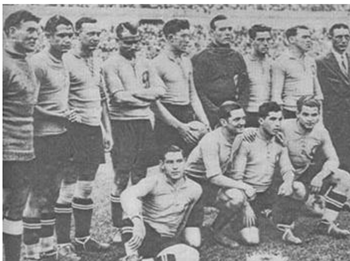
Selecció Catalana de futbol el dia de la inauguració de l'Estadi. Entre d'altres jugadors, dos mites de l'època: Samitier (el quart de la fila de dalt) i Zamora (el sisè). Any 1929

Amb els anys, el recinte es va anar degradant per manca d'activitats i es va estar a punt d'enderrocar-lo. (El que subscriu recorda haver-hi entrenat molts dissabtes pel matí, escortat per unes grades en runes i uns vestuaris que feien pena). Afortunadament, els Jocs del 92 van rescabalar-lo.