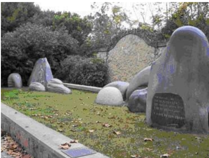
Conjunt escultòric en honor de Young -Cho Hwang, guanyador de la marató olímpica del 92 en 2h 13' 23"

Avançant per l'avinguda, albirarem l' Estadi , cada vegada més a prop. Quan estiguem davant de la magnífica Porta de Marató -que s'ha mantingut intacte a com era quan es va construir el vell estadi l'any 1929- tindrem en front a la nostra esquerra, unes curioses escultures: un conjunt en homenatge a Young -Cho Hwang , guanyador de la marató dels Jocs del 92, que va ser regalat pel govern de Corea a Barcelona. Que ningú s'esforci en traduir el rètol mentre correm; diu així " Catalunya, país afavorit per l'art i la història. Barcelona, antiga i gloriosa ciutat. Kyonggi-do estat de Corea, terra d'oriental tranquil·litat. La seva llum brillant ens uneix, Ah! Que sigui perpètua aquesta càlida amistat ". Es probable que, en passar, hi veiem turistes orientals llegint-lo i fent-se un munt de fotografies al costat del monument a l'atleta coreà, a qui consideren -i no els hi ho negarem- un heroi.