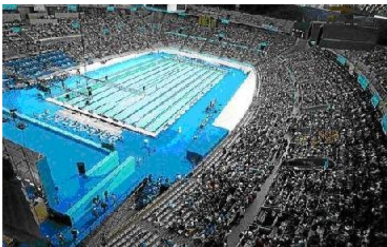
Piscina a l'interior del Palau Sant Jordi. Campionats del Món de Natació'2003

Sortirem de l' Estadi , contents, i anirem a buscar una drecera a la dreta per passar per darrere del Palau Sant Jordi . Un Palau que, a diferència de la Torre de la Telefònica que té al costat (ja he dit que són coses meves; no en feu cas), m'agrada molt. De fora, una meravella, i de dins una altra. Només cal veure que, per la seva versalitat, s'hi pot celebrar de tot, fins i tot campionats del món de...natació!