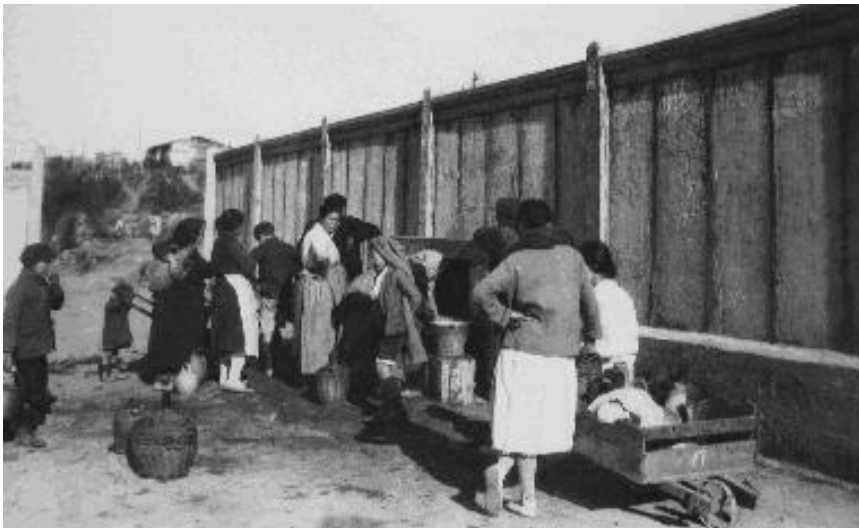
Una de les fonts de Can Valero. A l'esquerra l'entrada al barri, "amagat" per una tàpia que el cerclava.